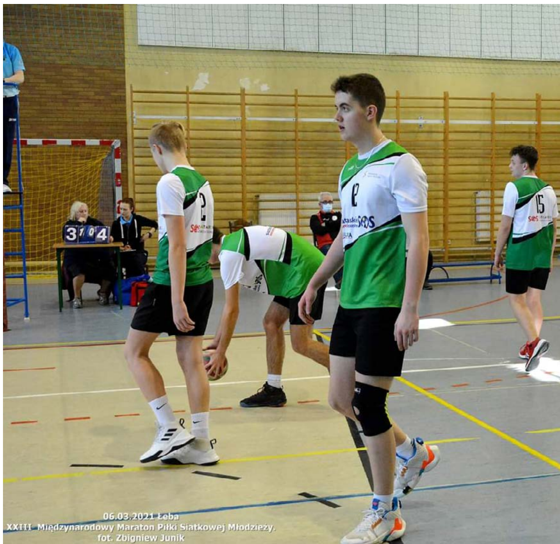
06.03.2021 Łeba XXIII Międzynarodowy Maraton Piłki Siatkowej Młodzieży.